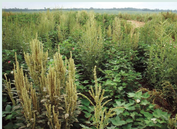
Figura 6. Infestación de A. palmeri con una franja de labranza.