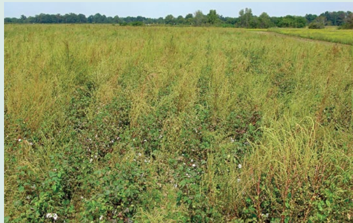
Figura 4. Algodonero infestado con A. palmeri resistente al glifosato.

Adicionalmente, los requerimientos establecidos en Alabama también especifican que “todos los cultivos en rotación deben estar actualmente bajo el sistema de labranza de conservación”. Los requerimientos de Tennessee incluyen el que se elabore un plan de actividades de conservación. Las prácticas de Alabama y Tennessee para pagos mínimos requieren que exista una rotación en el modo de acción de los herbicidas, control de malezas después de la cosecha y el mantenimiento o mejoramiento de las prácticas actuales de conservación. Además de dichos requisitos, se espera que los productores realicen revisión del predio (scouting), remuevan mecánicamente las malezas resistentes a herbicidas para prevenir la producción de semillas, minimicen la perturbación de residuos dentro de los surcos, utilicen aspersora con campana, incrementen los residuos de la cosecha y limpien el equipo. Para recibir el pago más alto, los agricultores deben poner en práctica un sistema de cultivo de cobertura con alta cantidad de residuos y en Alabama el uso de un rodillo de compactación que aplasta la parte superior del cultivo de cobertura y facilita la siembra. Una opción de rotación basada en pastos en la que se rotan cultivos forrajeros con cultivos agrónómicos, está disponible en Tennessee.