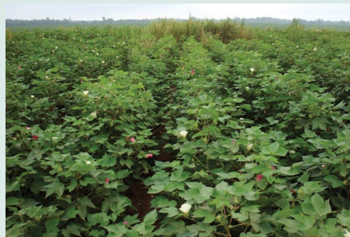
Figura 5. Reducción en la infestación del algodónero con A. palmeri después de labranza invertida y de aporque. Al fondo se aprecia el control sin tratamiento.