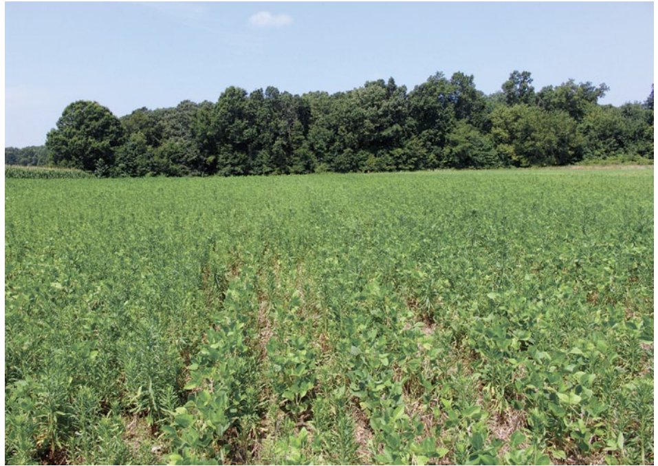
Figura 3. C. canadensis resistente al glifosato en un campo de Tennessee con el sistema de labranza de conservación.

La adopción rápida de los cultivos resistentes al glifosato se debió fundamentalmente a la efectividad que tiene este químico en las malezas de importancia económica, así como la facilidad de utilizar solo el glifosato para el control de malezas. La efectividad del control de malezas con los cultivos resistentes al glifosato constituyó un apoyo para la adopción amplia de los sistemas sin labranza que mejoró el uso del suelo y de los recursos energéticos (Gianessi 2008). En términos funcionales, el control de malezas en los cultivos resistentes a glifosato (por ejemplo, alfalfa, canola, maíz, algodón, soya y remolacha) ha minimizado la necesidad de realizar una